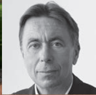
Prof. Dr. Norbert Bolz

Ex-Management Swarovski, Wien, mit dem Vortrag „Meuterei des Denkens“