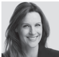
Moderation: Kay-Sölve Richter ZDF