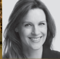
Kay-Sölve Richter Moderatorin beim ZDF

10. Dezember 2015 | Festsaal im Rathaus Münster