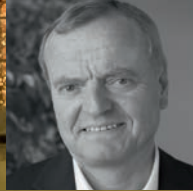
Prof. Dr. Dr. Manfred Spitzer Psychiater, Psychologe und Hirnforscher Uni Ulm