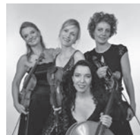
Musik: Les Sirènes Streichquartett Klassik|Tango|Pop