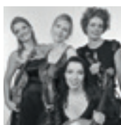
Musik: Les Sirènes Streichquartett Klassik | Tango | Pop