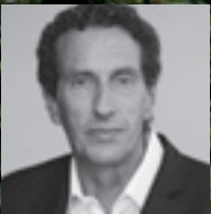
Prof. Dr. Julian Nida-Rümelin

Professor für Philosophie, Staatsminister a. D., LMU München