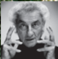
Prof. Sammy Molcho

Professor für Philosophie, Staatsminister a. D., LMU München