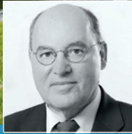
Dr. Gregor Gysi

Benediktiner und Bestsellerautor, Abtei Münster-schwarzach